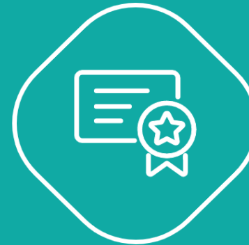
Módulo Boas Práticas