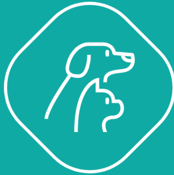
Módulo Cães e Gatos