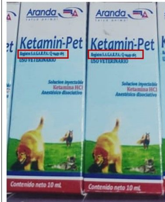
Imagen que describe el o los defectos

El producto realiza descripción del número de registro erróneo