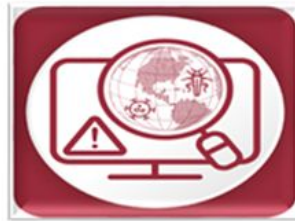
Monitor de Riesgos