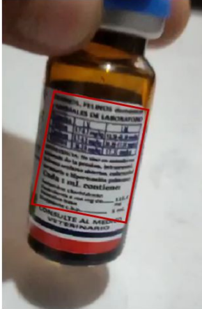
Imagen que describe el o los defectos

El producto no presenta la descripción de las indicaciones de uso, tiempos de retiro y advertencias