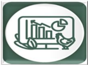
Sistema de Información de Acciones Sanitarias (SIAS)