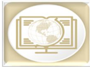
Atlas de Sanidad e Inocuidad Agroalimentaria (ASIA)